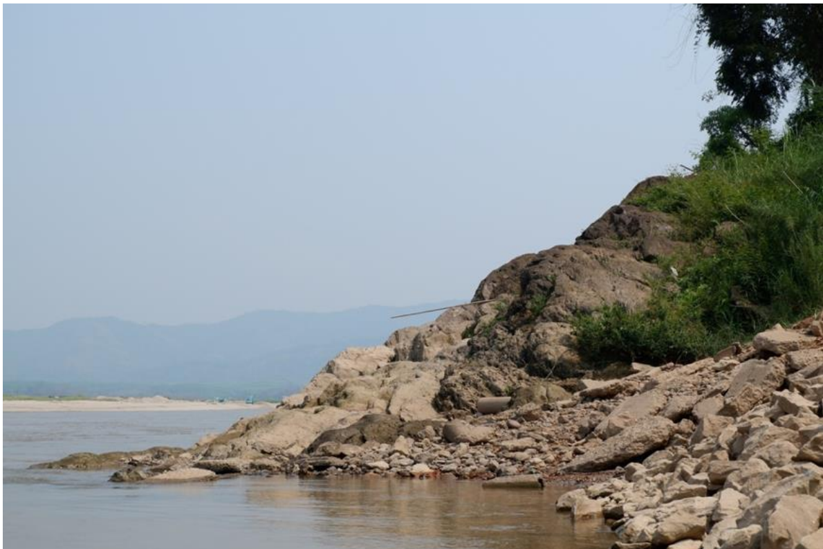
แจมปองใหญ่

บ้านแจมปองมีระบบนิเวศที่แบ่งตามระบบความรู้พื้นบ้านทั้งหมด 5 ระบบ ได้แก่ ผา ร้อง ดอน หาด และแจม จำนวน 8 แห่งซึ่งแตกต่างกันได้แก่ ผาวัว ผาเต่า ผาเปิด ร้องแคกุง ดอนกว้าง หาดโก แจมปองน้อย และแจมปองใหญ่ และชาวบ้านพึ่งพาอาศัยทรัพยากรเหล่านี้เป็นแหล่งของการหาอาหารแตกต่างกันไป เช่น บริเวณผาเปิดชาวบ้านจะไปหว่านแห ไล่เบ็ด ยกยอ เพราะบริเวณผาจะเป็นที่วางไข่ของปลา บริเวณหาดโก ดอนกว้าง ชาวบ้านมักจะไปเก็บโก ไทลมอง ซ้อนกุง บริเวณแจมปองใหญ่ ชาวบ้านมักจะไปไล่เบ็ด ยกยอ เพราะเป็นพื้นที่วางไข่ของปลาและมีปลาชุกชุมบริเวณนี้ ซึ่งระบบนิเวศทุกชนิดล้วนมีความสำคัญกับวิถีชีวิตของชุมชนบ้านแจมปอง