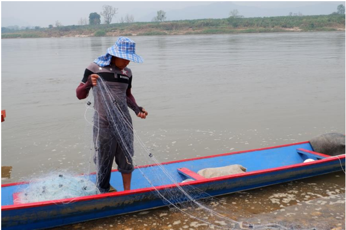
ชาวประมงกำลังเตรียมตัวไปหาปลา

การประมงพื้นบ้านเป็นอาชีพคู่กับชุมชนริมโขง บ้านแจมปองมีอาชีพหลักคือ ทำไร่ ทำนา การประมงพื้นบ้านจะเป็นอาชีพเสริมที่ชาวบ้านจะทำเมื่อถึงฤดูปลาขึ้น คือ เริ่มตั้งแต่เดือนมกราคมไปจนถึงเดือนมิถุนายน ช่วงที่มีคนหาปลามากที่สุดคือเดือนเมษายนกับเดือนพฤษภาคม เพราะเป็นช่วงที่ปลาอพยพออกมาจากแม่น้ำสาขาของแม่น้ำโขง เมื่อว่างเว้นจากการทำสวนชาวบ้านก็จะมาหาปลา บ้านแจมปองมี “ลั้ง” หรือจุดหาปลาอยู่ 2 จุด คือ ลั้งหาดไถและลั้งปากงาว ลั้งหาดไถจะตั้งอยู่ที่บริเวณหาดไถทางเหนือของหมู่บ้านระยะห่างจากตัวหมู่บ้านประมาณ 2 กิโลเมตร ลั้งหาดไถส่วนใหญ่จะเป็นพื้นที่ขี้ผึ้งที่ขี้ผึ้งมาจากฝั่งลาวมาหาปลาบริเวณนี้ ส่วนลั้งปากงาวจะตั้งอยู่ที่ท้ายหมู่บ้านระยะห่างประมาณ 4 กิโลเมตร ที่เรียกลั้งปากงาวก็เพราะว่าตั้งอยู่ใกล้กับบริเวณที่แม่น้ำงาวไหลลงสู่น้ำโขงจึงเรียกว่า คนที่มาหาปลาที่ลั้งนี้ส่วนใหญ่จะเป็นคนในหมู่บ้านมีบ้างที่พี่น้องทางฝั่งลาว และจะมีการต่อคิวช่วงเดือนเมษายน-พฤษภาคมเท่านั้นเนื่องจากเป็นฤดูหาปลา ชาวบ้านบางคนก็มาใช้ชีวิตอยู่ที่ลั้งตลอดฤดูหาปลาเพราะสามารถหาปลาได้ตลอดทั้งวันทั้งคืน พอหมดช่วงฤดูหาปลาก็กลับไปใช้ชีวิตที่บ้านตนเองในหมู่บ้านตามปกติ